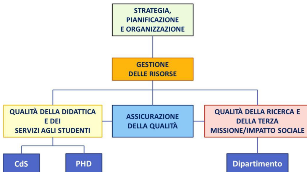
Figura 1 – La struttura del Modello AVA3 (LINEE GUIDA PER IL SISTEMA DI ASSICURAZIONE DELLA QUALITÀ NEGLI ATENEI)