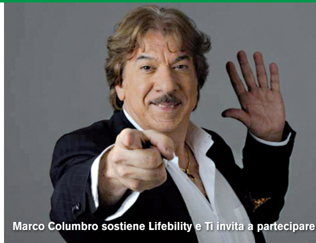
Marco Columbro sostiene Lifability e Ti invita a partecipare