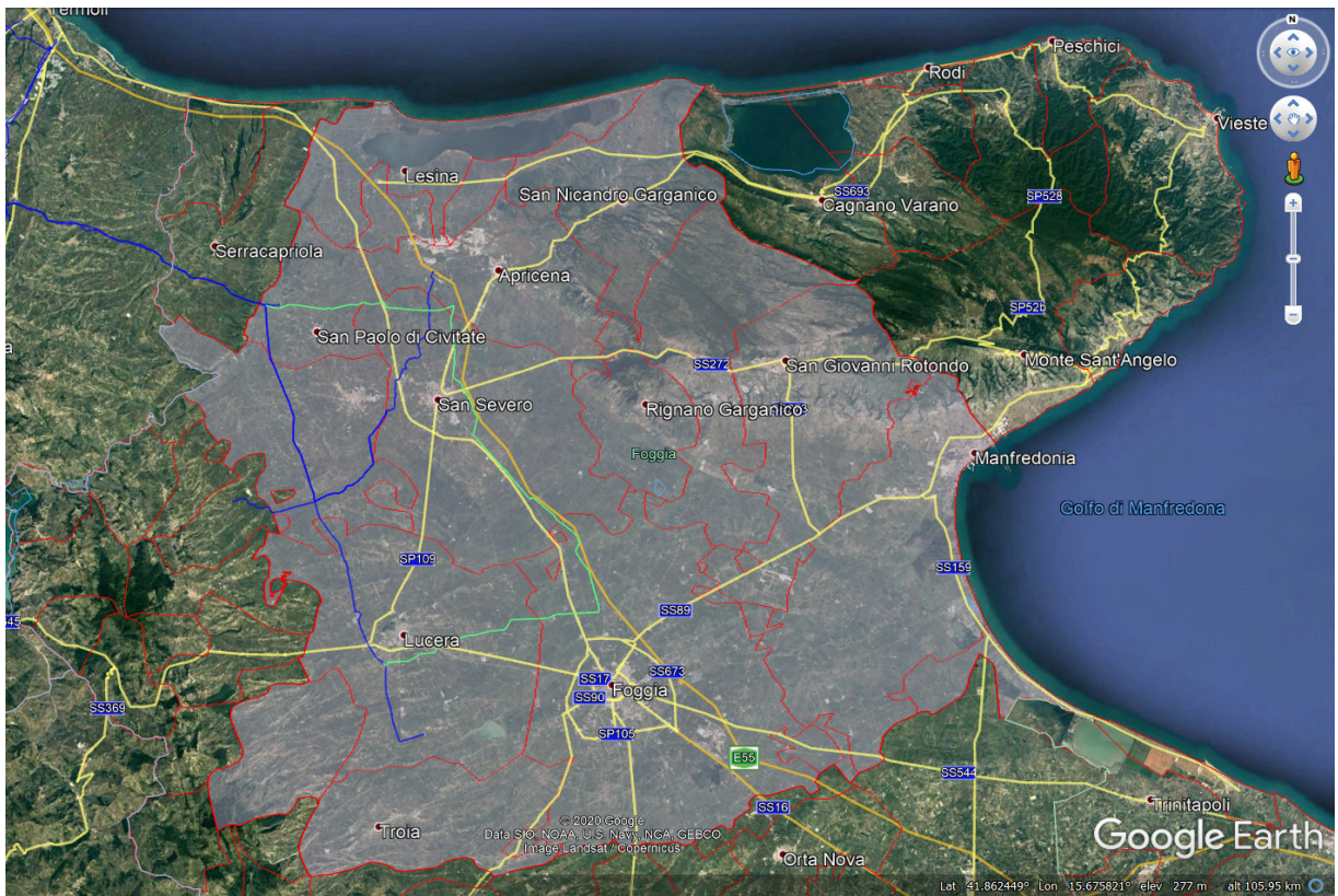
Figura 2 - Area specifica di intervento