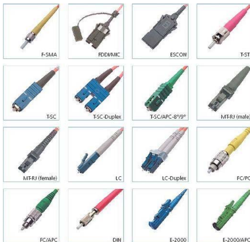
Fig. 3 - Connettori ottici più comuni